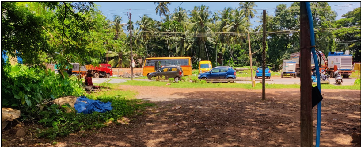
പദ്ധതിയുമായി ബന്ധപ്പെട്ട സർക്കാരിന്റെ പുറമ്പോക്ക് ഭൂമി