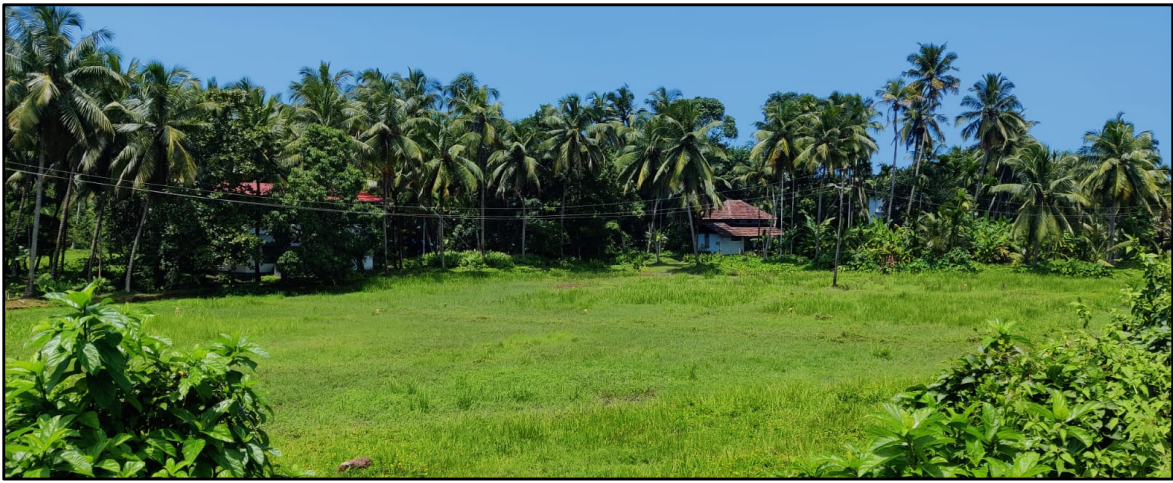
പദ്ധതിയുമായി ബന്ധപ്പെട്ട വയൽ