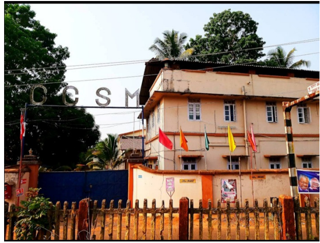
സ്പിന്നിംഗ് മിൽ (ഭാഗികമായി ബാധിക്കുന്നു)