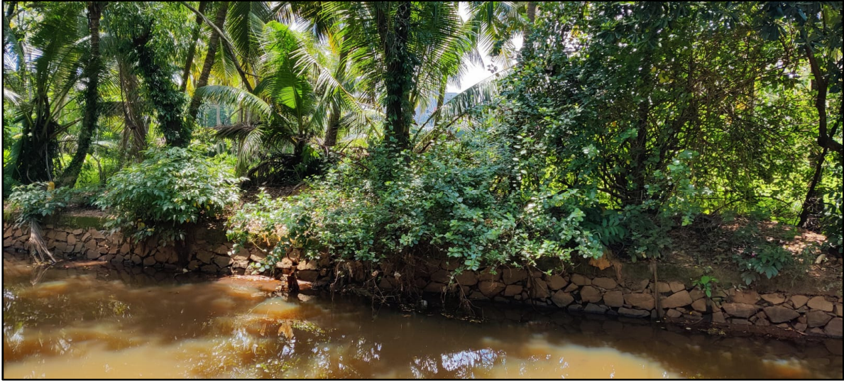
കീഴ്ത്തള്ളി ഭാഗത്തു നിന്നുള്ള ദൃശ്യം