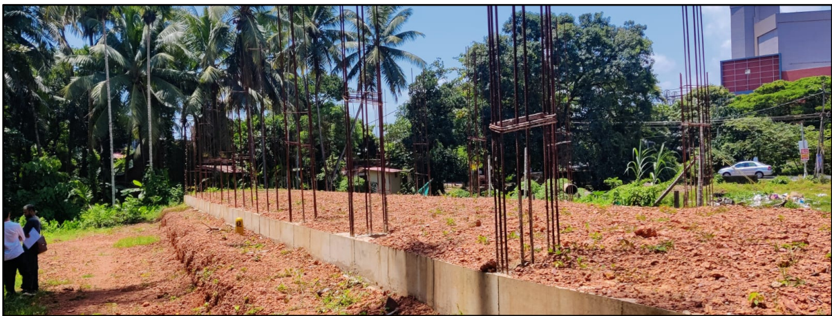
കീഴ്ത്തള്ളി ഭാഗത്തു നിന്നുള്ള ദൃശ്യം - പൂർണ്ണമായി ബാധിക്കുന്നു