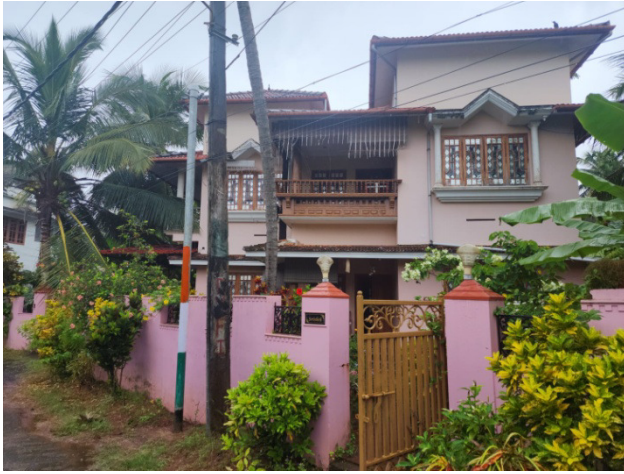
പൂർണ്ണമായി ബാധിക്കുന്ന വീട്